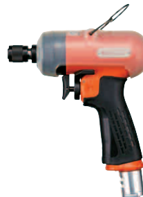
FL-4D, 5D, 6D ピストル型ドライバ