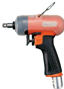
FL-4, 5, 6 ピストル型レンチ