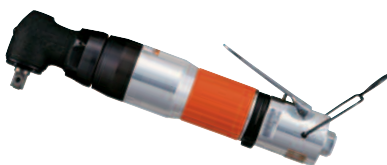
FL-4SC, 5SC, 6SC