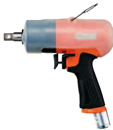
FL-7, 9, 11, 13 ピストル型レンチ