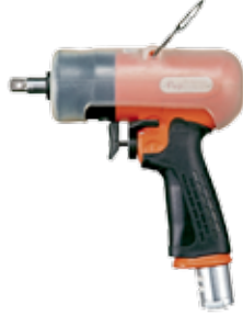
FL-7, 9, 11, 13 方头驱动