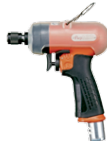
FL-4D, 5D, 6D 批头类型