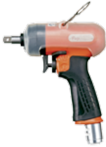
FL-4, 5, 6 方头驱动