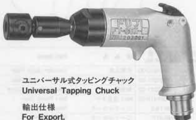
ユニバーサル式タッピングチャック Universal Tapping Chuck