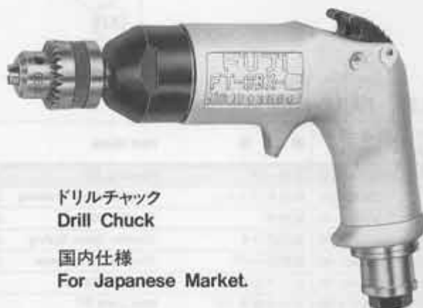
ドリルチャック Drill Chuck